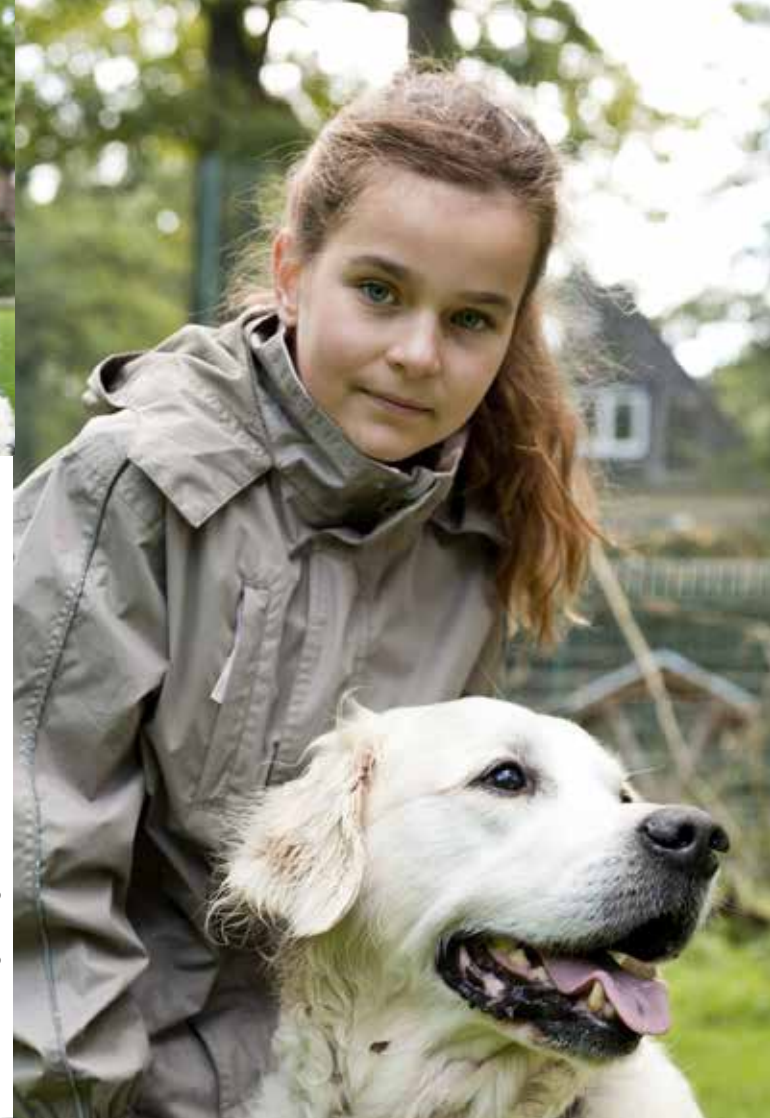
Gestaltung: Grafikgemeinschaft BLATTWERK, Fotos: Jonas Gonell